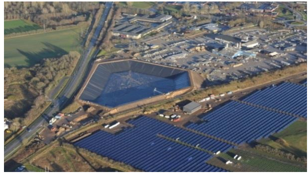
Wärmespeicher Vojens zu Beginn der Befüllung